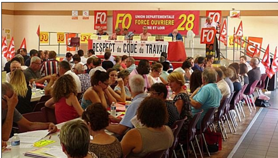
200 syndicalistes FO ont tenu leur congrès le 22 juin 2017 en Eure-et-Loir avec en arrière fond la réforme du Code du travail.

L'inscription sur le calicot fixé à la tribune a d'emblée annoncé la couleur : Respect du Code du travail. La résolution, adoptée à l'unanimité, a notamment réaffirmé la primauté absolue de la loi sur toute forme de contrat collectif et individuel ; la primauté absolue de l'accord de branche sur l'accord d'entreprise ; le respect de la justice prud'homale ; le respect du mandat et du rôle de chaque institution représentative du personnel (DP, CE, CHSCT).